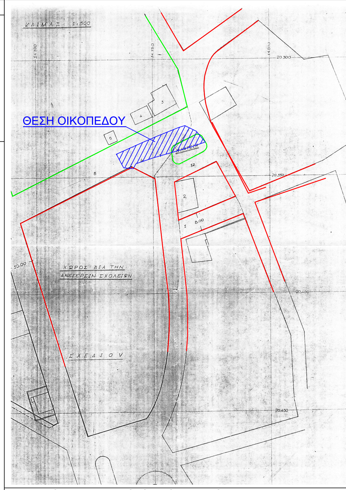
ΑΠΟΣΠΑΣΜΑ ΡΥΜΟΤΟΜΙΚΟΥ ΣΧΕΔΙΟΥ ΚΛΙΜΑΚΑ 1:1000 (Τροποποίηση Ρυμοτομικού Σχεδίου ΦΕΚ 138 Δ' 12-6-1972)