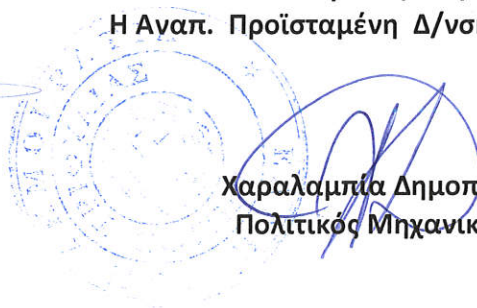
Χαραλαμπία Δημοπούλου Πολιτικός Μηχανικός